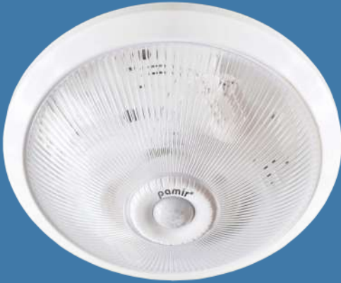
SGS 10 - SGS 20